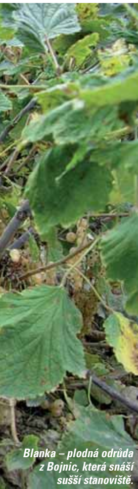
Blanka – plodná odrůda z Bojnic, která snáší sušší stanoviště.

sladkokyselá, aromatická chuť plodů , které neztrácejí na své kvalitě a dají se konzumovat i po přezrání někdy i začátkem září . Jde o vitální, plastickou odrůdu, která má nejchutnější plody z popisovaných bílých rybízů . Netrpí antraknozou ani padlím.